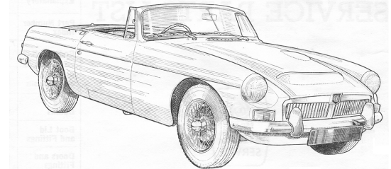
The MGC Tourer